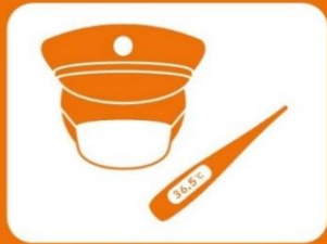
マスクの着用・健康管理