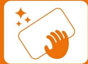
定期的な清掃・消毒