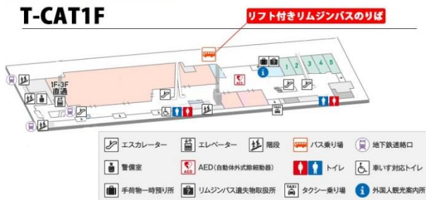
TCAT 1階羽田空港行きリムジンバスのりば