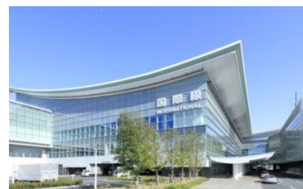
提供：東京国際空港ターミナル